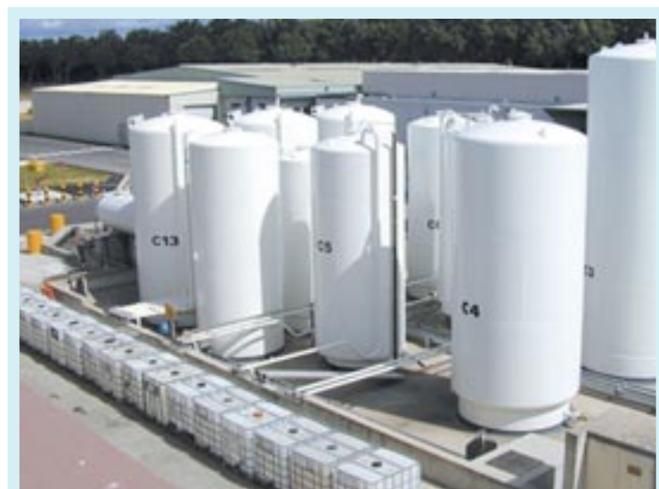
Stockage des Neutralène® et des Bioclean® pour des livraisons en vrac ou en containers GRV

Storage of Neutralene® and Bioclean® for bulk consignments or intermediate bulk container deliveries.